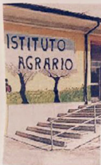
L'Istituto agrario di Pratola

Pratola Peligna, si parla di cinema e disagi sociali oggi all'Istituto agrario con il film "Si può fare"