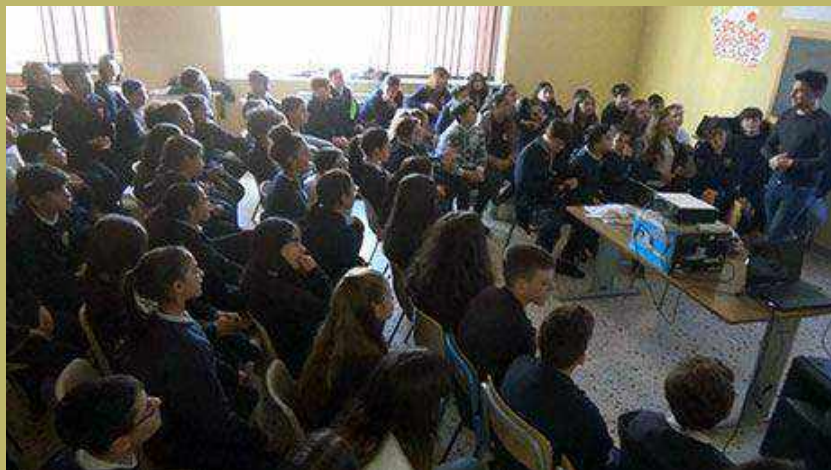
Inserito da Golfonetwork martedì 26 novembre 2019 alle 21:26

Eventuali commenti non visibili sono in fase di approvazione.