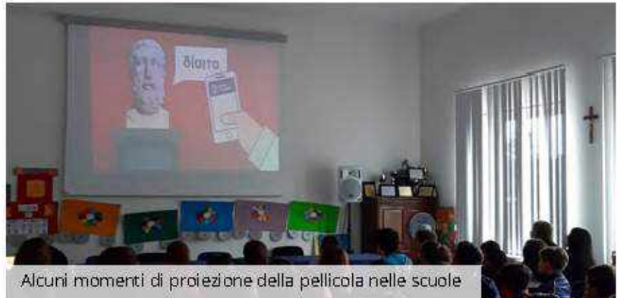
Alcuni momenti di proiezione della pellicola nelle scuole