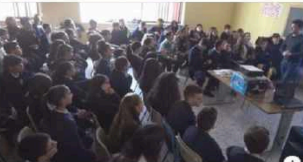
TVOGGISALERNO.IT CIBOCILENTOCINEMA, GRANDE ENTUSIASMO NEGLI ISTITUTI SCOLASTICI PER IL PROGETTO DELLA...

Salerno TvOggi 26 novembre alle ore 18:30 · CIBOCILENTOCINEMA, GRANDE ENTUSIASMO NEGLI ISTITUTI SCOLASTICI PER IL PROGETTO DELLA FONDAZIONE ALARIO Al via le sessioni didattico seminariali negli Istituti della Campania che hanno aderito al progetto... https://www.tvoggisalerno.it/cibocilentocinema-grande-entu.../