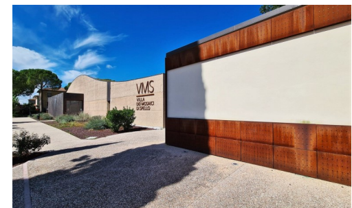
Villa dei Mosaici di Spello: vista interna ed esterna