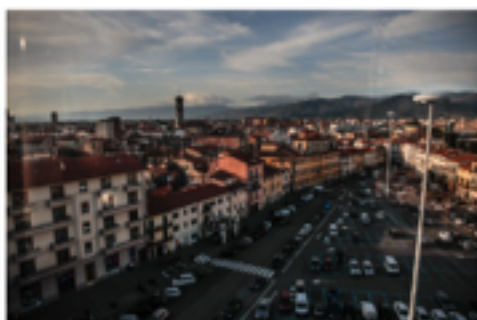
Storografia di Roberto Cecchetti

Persone e realtà che si sono contraddistinte in questo 2022, secondo Pratosfera. Arrivati a questo punto dell'anno, un momento di classiche, bilanci e buoni propositi, è doveroso domandarsi: "per cosa ti ricorderemo questo anno?".